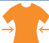
SEMI FITTED PRO

Ultra-slim fit and athletic cut nipped at the waist to ensure mobility and comfort.