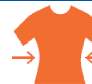
SEMI FITTED JUNIOR PRO

Semi-slim and athletic cut nipped at the waist to ensure mobility and comfort.